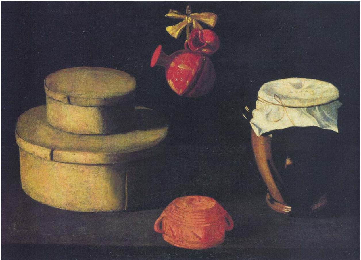
Figura 3 – Josefa de Óbidos, Natureza Morta , óleo sobre tela, 1655-1665

Dimensione o seu trabalho tendo em conta o espaço da folha de prova e o meio actuante escolhido.