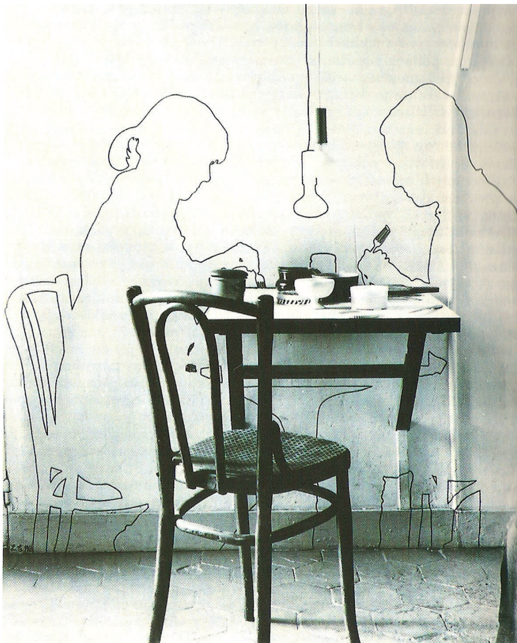
Figura 3 – Lourdes Castro, Sombras projectadas de Lourdes Castro e René Bertholo , rue des Saints Pères, 1964