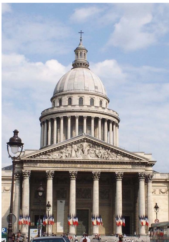
Figura 5 – Jacques-Germain Soufflot, Igreja de Santa Genoveva ou Panteão, Paris, c. 1755-61