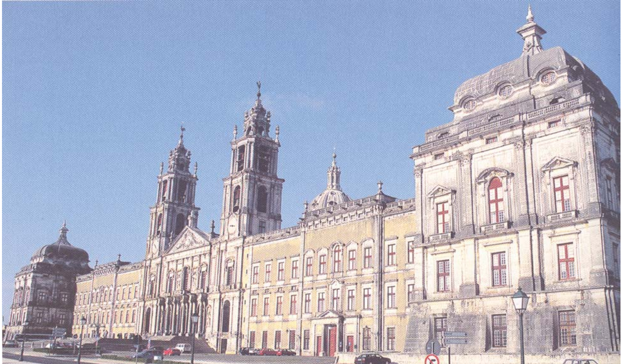
Figura 4 – Fachada principal do Real Edifício de Mafra , in Ana Lúcia Pinto et al. , Arte Portuguesa , Porto, Porto Editora, 2006

1. Indique, em relação ao edifício reproduzido na Figura 4: