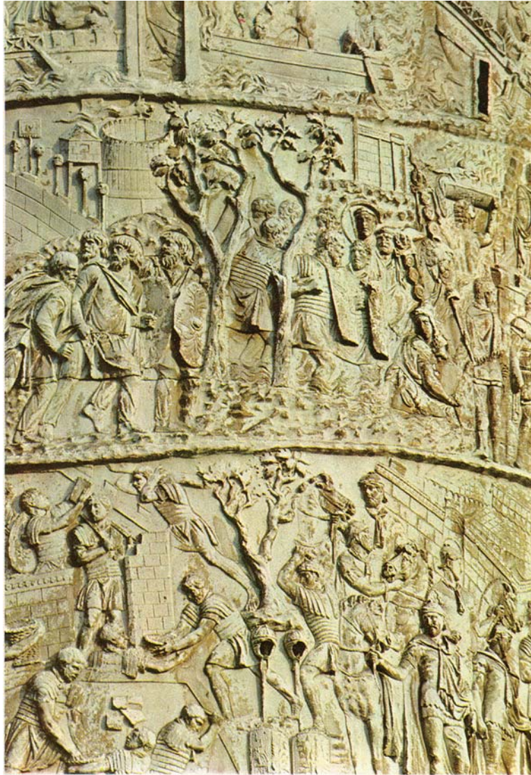
Figura 3 – Pormenor do relevo da Coluna de Trajano , 112-114 d.C., mármore, Fórum Trajano, Roma, in M. Bonicatti, De la Grèce à Byzance , vol. II, Paris, Librairie Hachette, 1963

4. Analise a Coluna de Trajano nos seus aspectos formal e temático.