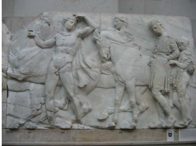
Figura 1 – Pormenor do friso interior do Pártenon , século V a.C., mármore, Museu Britânico, Londres

1. Selecciona a alternativa que indica o estilo e o tema do friso interior do Pártenon :