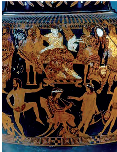
Figura 2 – Vaso de Pronomos, cerâmica ática, 410 a. C., pormenor do lado A

* 1.1. O Vaso de Pronomos (Figura 1) apresenta características próprias de uma