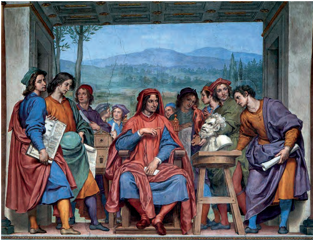
Figura 1 – Ottavio Vannini, Lourenço de Médicis entre Artistas , fresco do Palácio Pitti, Florença, 1636-1642