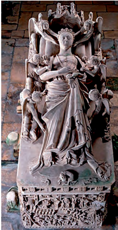
Figura 6 – Túmulo de D. Inês de Castro, Mosteiro de Alcobaça, 1357-1360