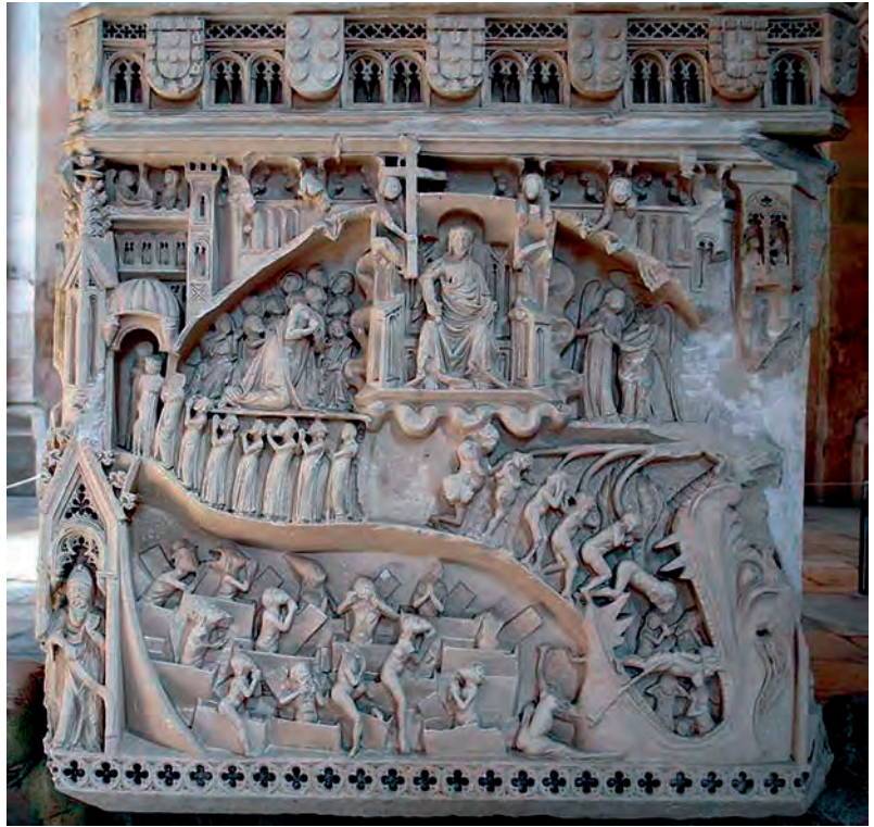
Figura 7 – Facial do Túmulo de D. Inês de Castro, Mosteiro de Alcobaça, 1357-1360

* 3.1. Identifique a temática representada na Figura 7.