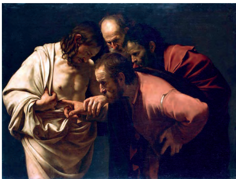
Figura 3 – Caravaggio, A Incredulidade de S. Tomé , 1601

Compare as pinturas reproduzidas nas Figuras 2 e 3.