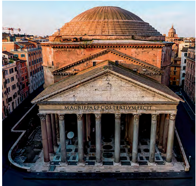
Figura 4 – Panteão , fachada, Roma, 118-125