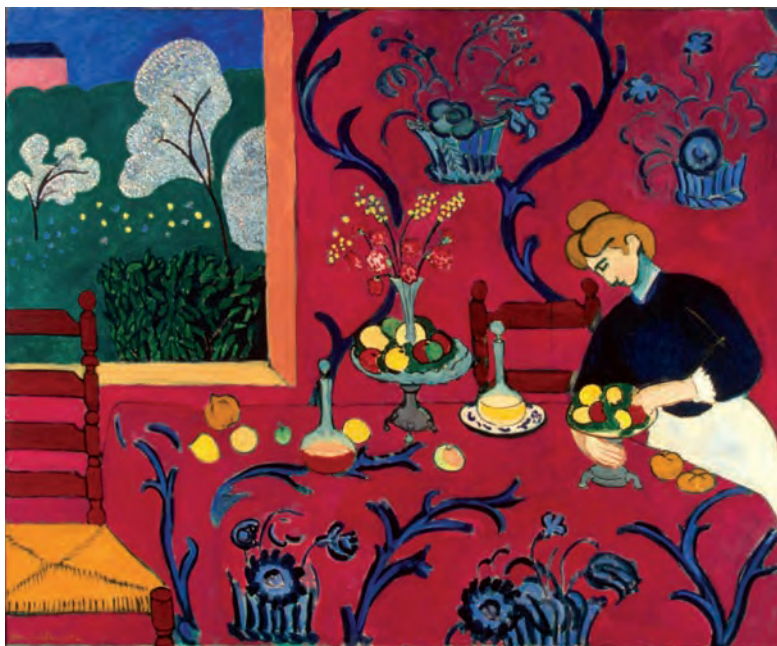
Figura 1 – Henri Matisse, Quarto Vermelho (Harmonia em Vermelho) , 1908, óleo sobre tela, 180,5 x 221 cm

* 2. Observe a Figura 1 e leia o Texto A.