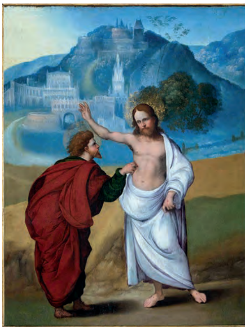
Figura 2 – Mazzola Ludovico, dito Mazzolino, A Incredulidade de S. Tomé , c. 1500