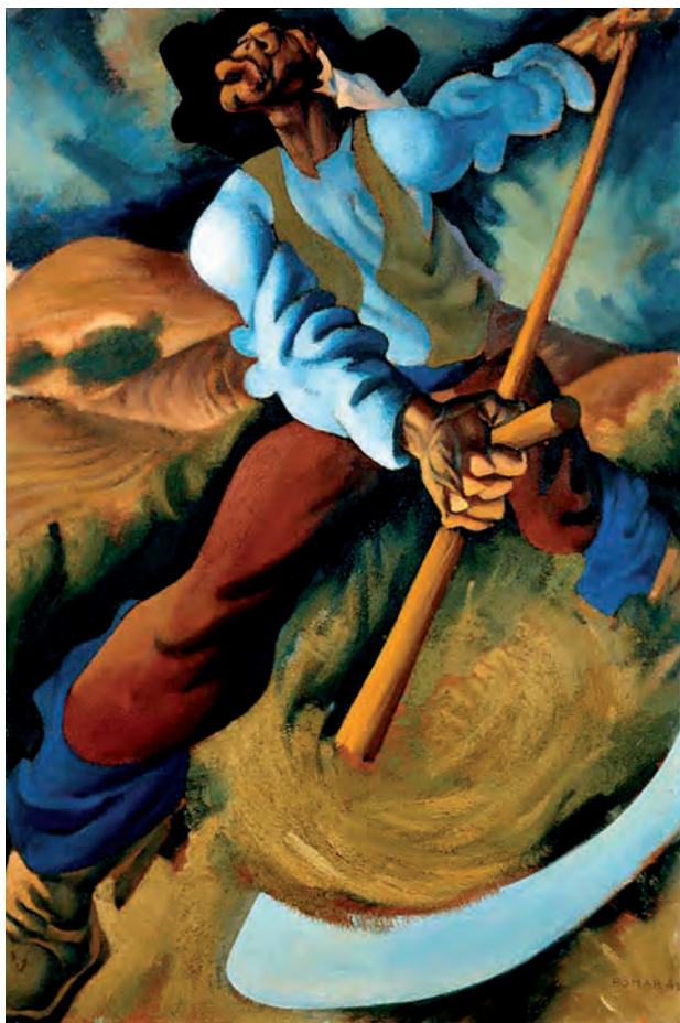
Figura 2 – Júlio Pomar, Gadanheiro , 1945, óleo sobre aglomerado de madeira, 122 x 83 cm