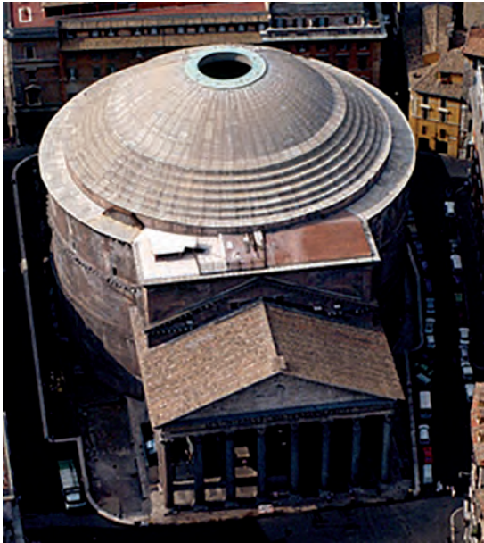
Figura 3 – Panteão , vista aérea, Roma, 118-125