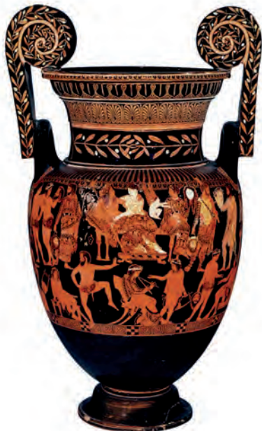
Figura 1 – Vaso de Pronomos (lado A), cerâmica ática, 410 a. C.