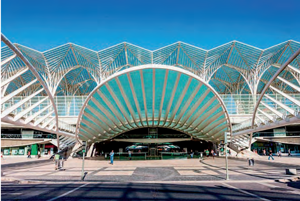
Santiago Calatrava, Gare do Oriente , Lisboa, 1994-1998

Associe a cada obra do conjunto documental ( A , B e C ), apresentado nas páginas 10 e 11, as características correspondentes, identificadas no quadro pelos números de 1 a 7 .