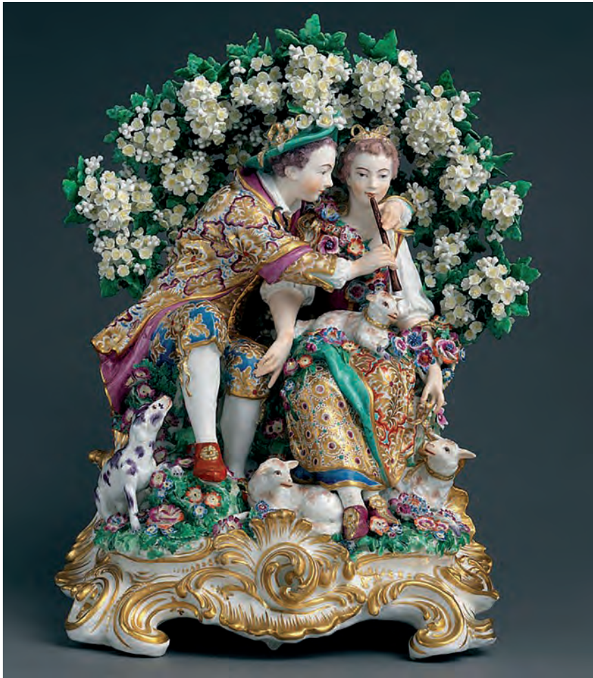
Figura 5 – Joseph Willems, A Lição de Música , modelado a partir de duas gravuras de François Boucher, Fábrica de Porcelana de Chelsea, 1765, 39 x 31 x 22 cm

in www.metmuseum.org (consultado em outubro de 2023).