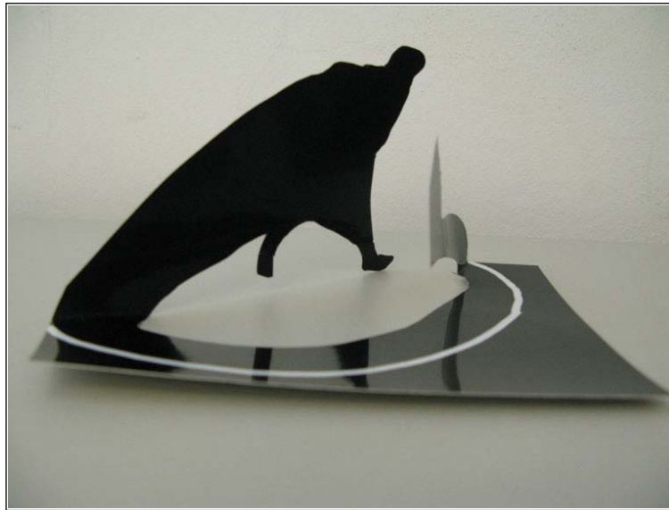
Figura 1 – Modelo tridimensional

Com o elemento anexo, adaptado de uma fotografia de Helena Almeida, forme o modelo tridimensional que vai utilizar de modo que fique semelhante ao que está representado na fotografia da Figura 1.