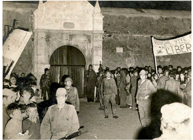
B – Libertação dos presos políticos da Cadeia do Forte de Peniche.