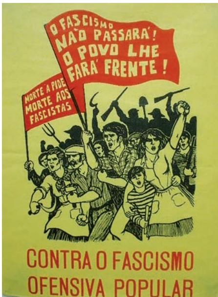
C – Cartaz produzido no contexto do Processo Revolucionário em Curso.